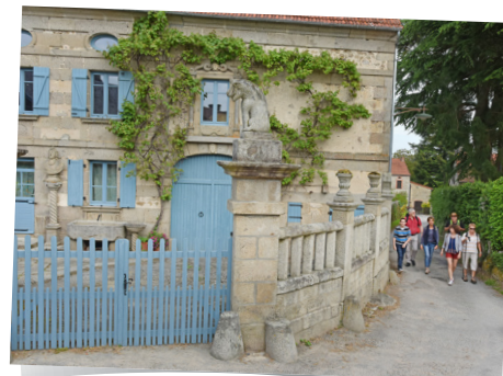
Le village sculpté de Masgot