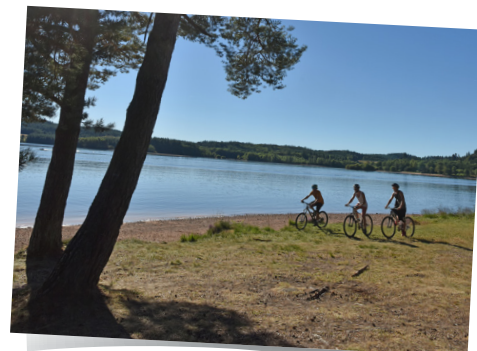
Le Lac de Vassivière